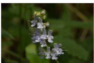
シマジタムラソウ