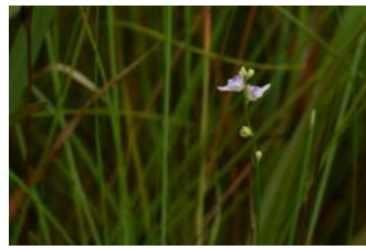
ホザキノミミカキグサ