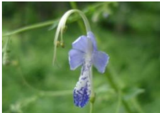
カリガネソウ(山野草園)