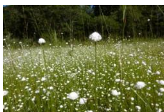
シラタマホシクサ